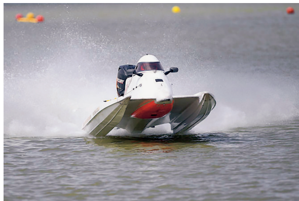
参赛选手在2022年中国摩托艇联赛宁夏沙湖大奖赛比赛中。