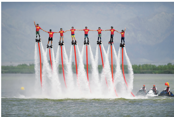
参赛选手在2022年中国摩托艇联赛宁夏沙湖大奖赛开幕式上进行“水上飞人”表演。